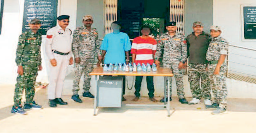
मुखबिर की सूचना पर सिंघनपुरी पुलिस ने की कार्यवाही