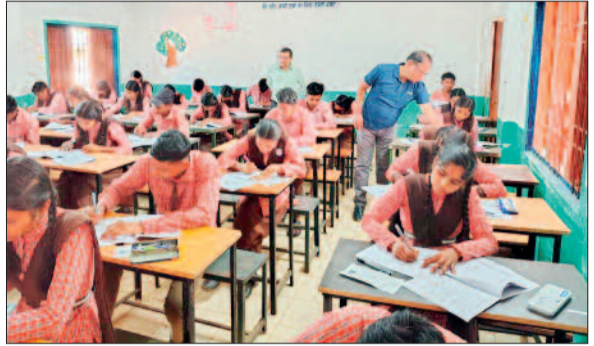
हरिभूमि न्यूज ► कवर्धा