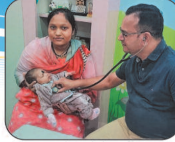
24 घंटे बच्चों के भर्ती व आपातकालीन इलाज