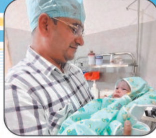
बच्चों के संपूर्ण टीकाकरण की सुविधा उपलब्ध