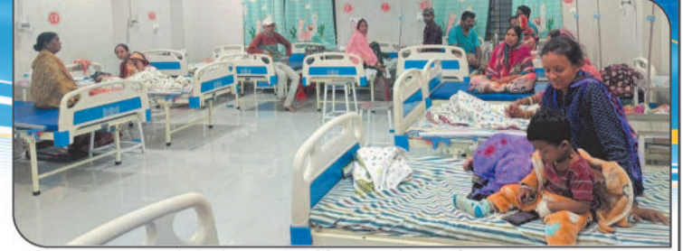
बच्चों के फ्रेक्चर, सर्जरी व ऑपरेशन की सुविधा सोनोग्राफी, एक्सरे एवं सभी प्रकार के पैथालॉजी जांच सुविधा उपलब्ध